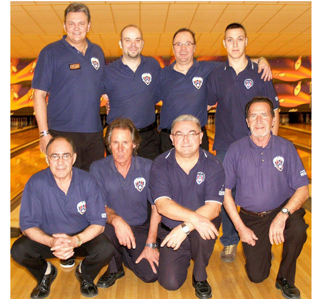
Equipo Campeón de la XXIII Liga Nacional de Bowling División de Honor Masculina.

de Cosmic Bowling de Valencia, los días 12 al 17 de Enero de 2010.